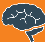
LLID YR YMENYDD