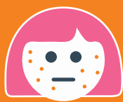
Y FRECH GOCH